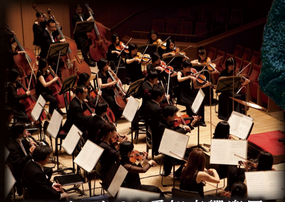
管弦楽 セントラル愛知交響楽団